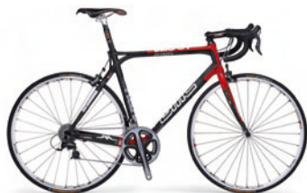
*Nominationen für den Design Preis Schweiz

Organisiert sind wir als Verein und sind Teil eines Netzwerks von öffentlichen und privaten Partnern.