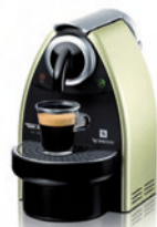
Nestlé Nespresso SA Kaffeemaschine Essenza* Design: A. und Ph. Cahen