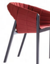
Wogg AG Stuhl wogg42* Design: Jörg Boner