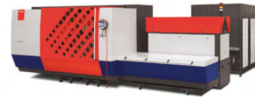
Bystronic Laser AG Laserschneideanlage ByVenton 3015* Design: Karel Formánek, Team Thomas Plüss